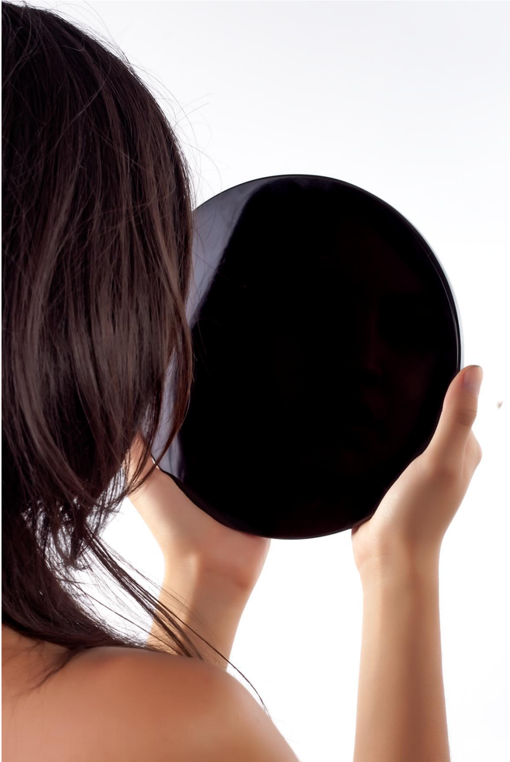
Tezcatlipoca , Eugenio Moreno Chávez, 2013.