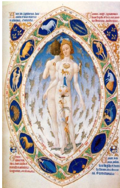
Zodiaco , Libro de las Horas del Duque de Berry, siglo XV

La astrología médica sugiere que en el caso de una intervención quirúrgica esta se practique de preferencia en Luna menguante para evitar sangrado profuso, pero sobre todo que no se encuentre la luna en el signo zodiacal que se va a operar, ya que en ese período de tiempo ese órgano es mas vulnerable.