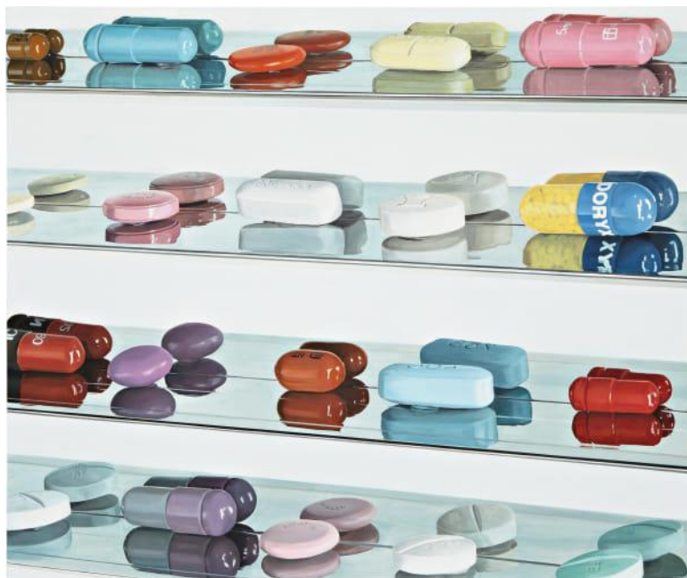
Damien Hirst, 20 píldoras , 2004