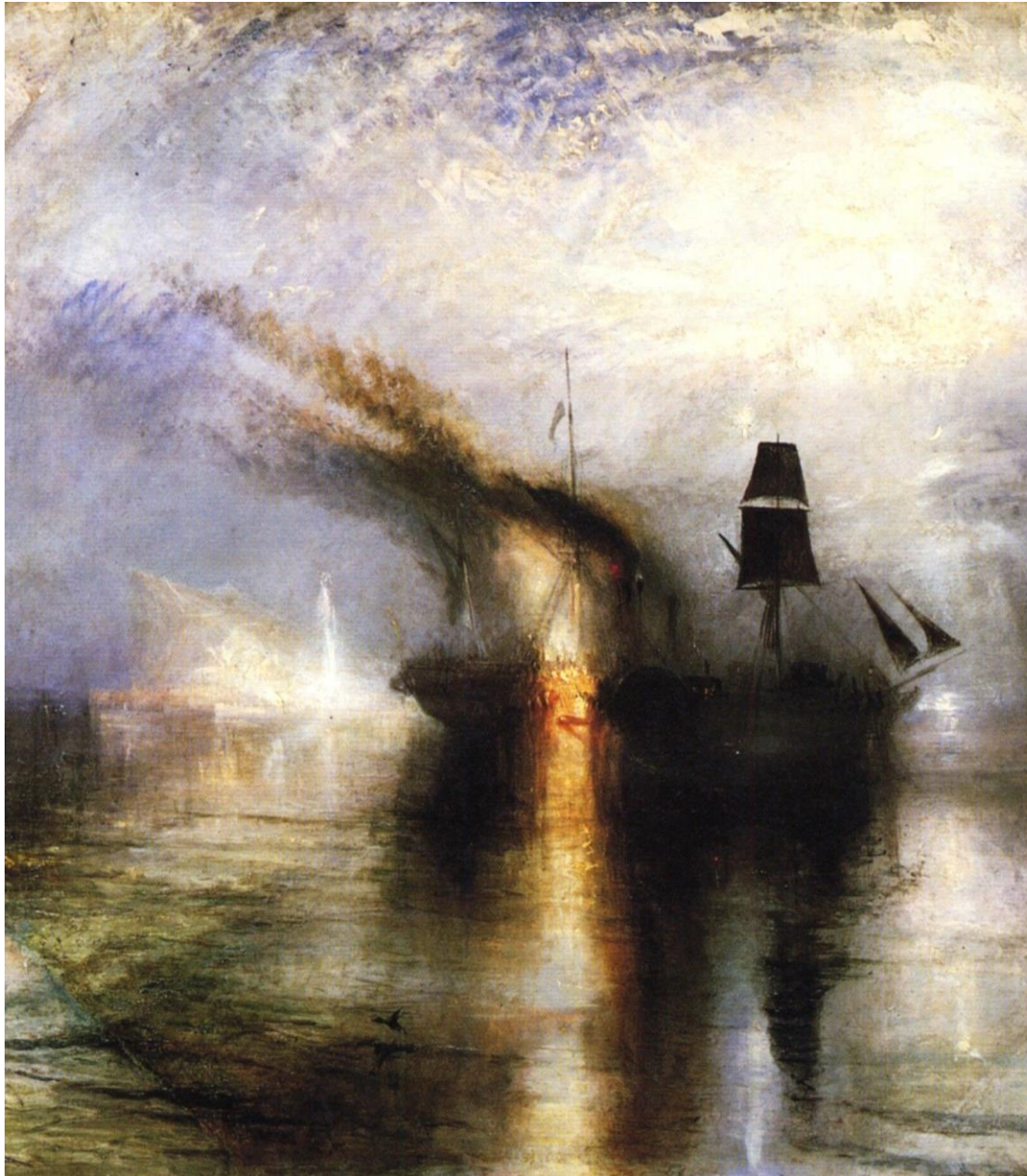
William Turner, Paz , 1841.