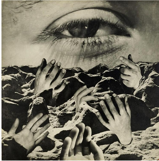
Grete Stern, Sueño 26 (El Ojo Eterno) , 1950

OBSINAUTAS es una publicación periódica de OBSIDIANAMX y la S.I.T.O Comentarios: comitepublicaciones@obsinautas.com