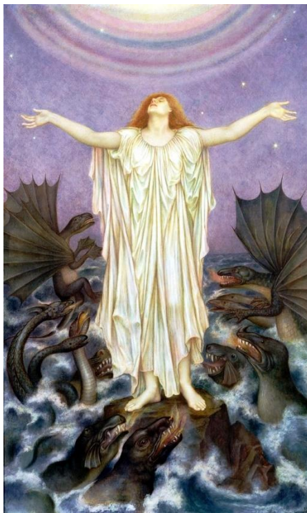
Evelyn de Morgan, S.O.S., 1914