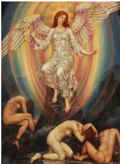
Evelyn de Morgan, La Luz Brilla sobre la Oscuridad , 1915.